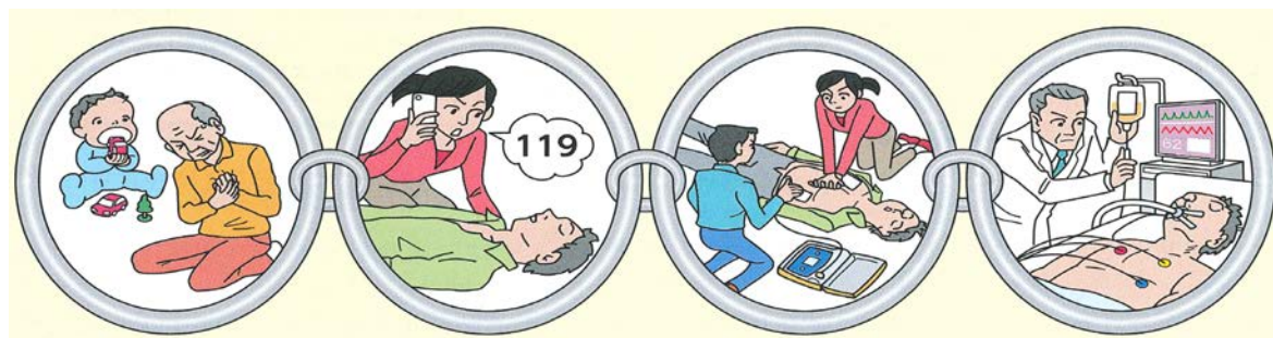
図：「救命の連鎖」の一例