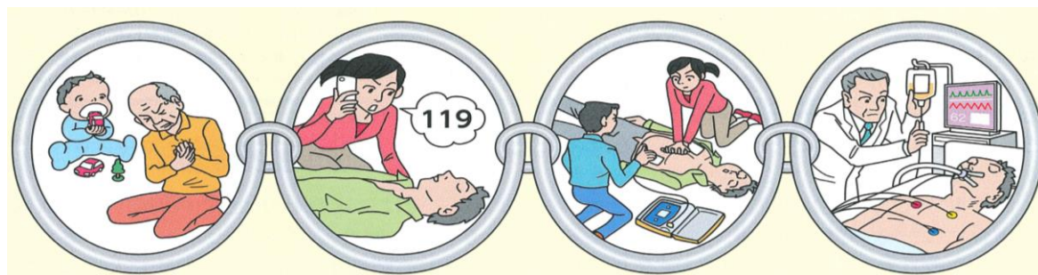
図：「救命の連鎖」の一例